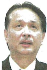
Datuk Dr Noor Hisham Abdullah

In addition to the 103 Cambodian passengers, there were also two Malaysians on board the flight.