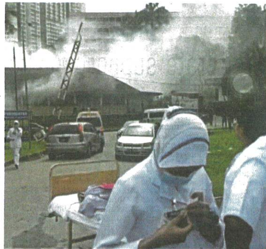
The early stages of the fire at Sultanah Aminah Hospital in Johor Baru, on Sunday.

was initially handled by the hospital's emergency response team, but when the fire flared anew, JBPM was deployed to the scene. No casualties were reported.