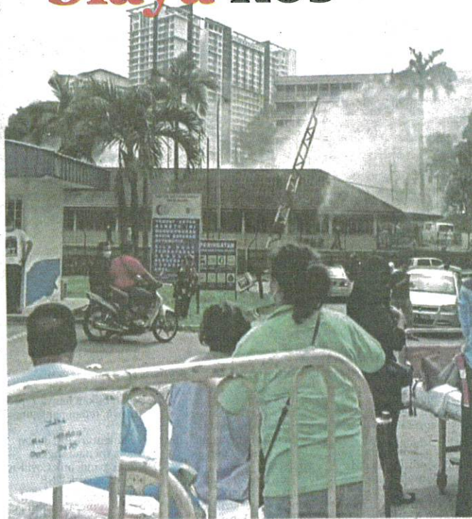
WAD Perubatan Perempuan Satu HSA terbakar kira-kira jam 2.50 petang kelmarin.