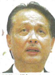
DR Noor Hisham

"Hari ini (semalam), setakat jam 12 tengah hari, terdapat tiga kes baharu dilaporkan. Ini menjadikan jumlah kes positif Covid-19 di Malaysia adalah sebanyak 8,637 kes.