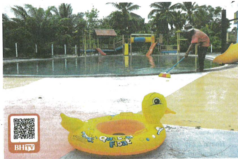
Pekerja membersihkan Taman Tema Air Mini Pok Nik di Kuantan, semalam.