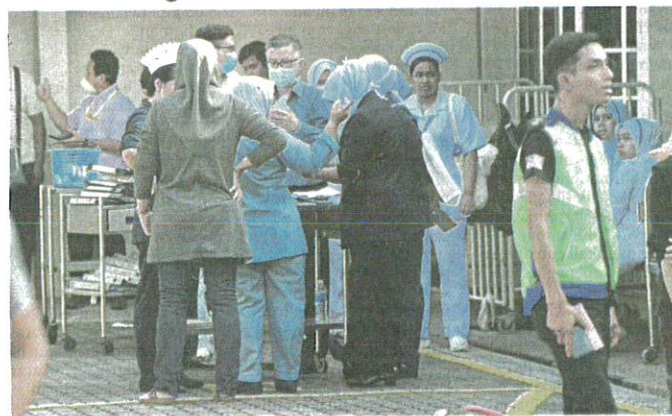
SERAMAI 24 pesakit dapat diselamatkan dalam kebakaran yang berlaku kelmarin.

nya dalam satu kenyataan di Facebook, semalam.